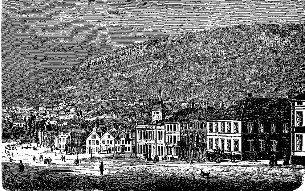
Torvet i Bergen.