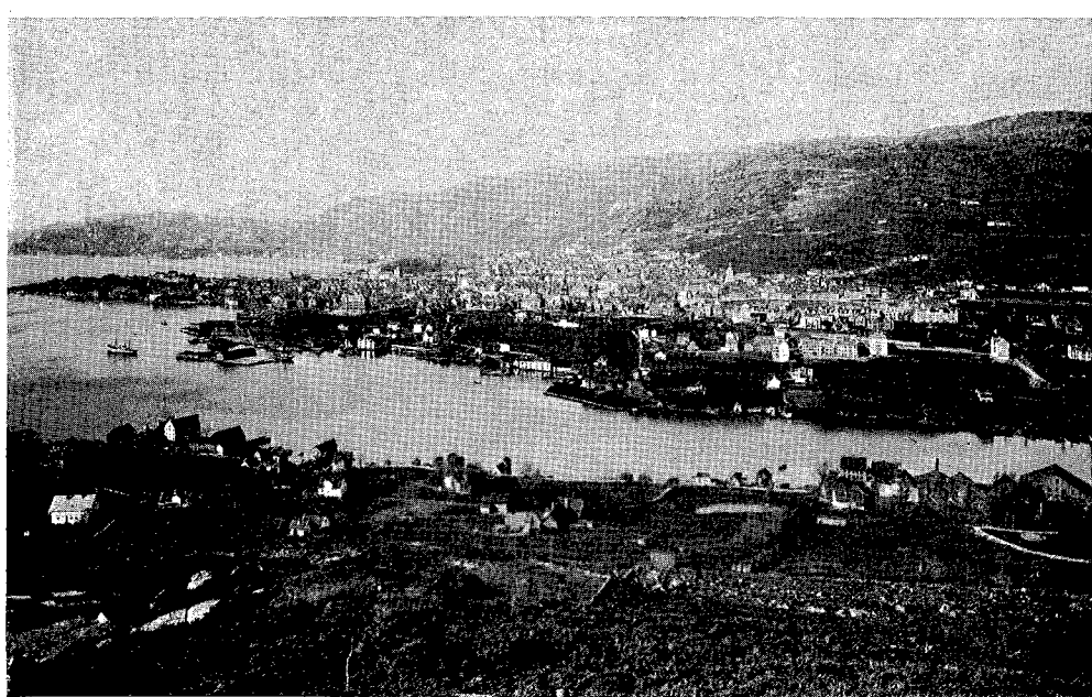
Fra Damsgårdsiden hvor plantingen begynte.

60 skilling pr. favn, (ca. kr. 2,— pr. 2 meter). Steingjerde som i tilfelle måtte gis en høyde av 10/4 alen med glatt utside mente man å kunne få for samme pris. Da selskapets midler på angjeldende tidspunkt var meget beskjedne fremkom forslag om å søke Statens Forstvæsen og Det Nyttige Selskab om tilskudd.