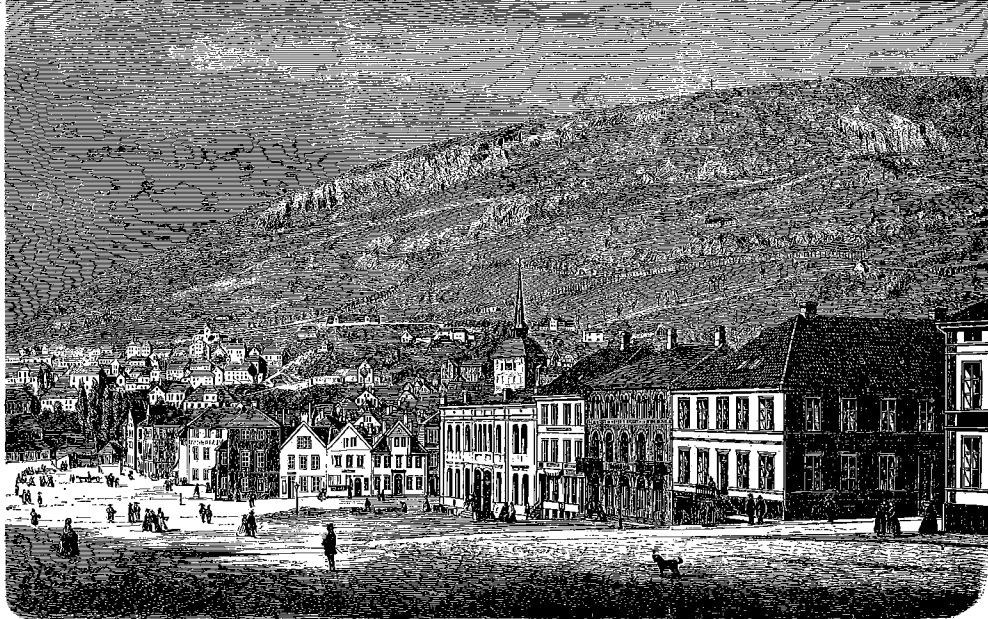
Torvet i Bergen.